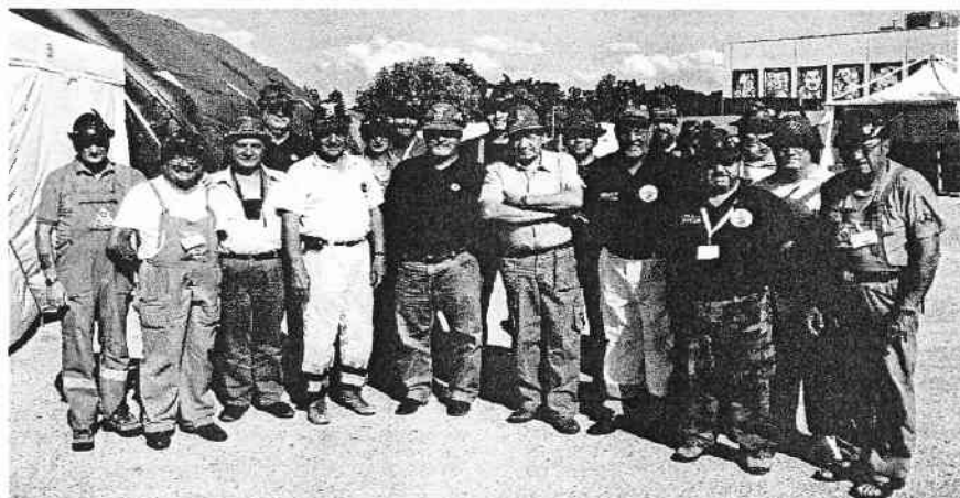
La visita del nostro Presidente nazionale