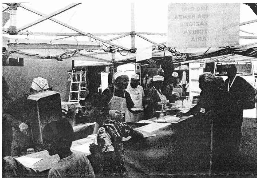
Momenti di vita al campo di Monticchio

ne ed ho potuto conoscere delle persone vere in carne ed ossa. Ho conosciuto uomini e donne come me, che avevano un vissuto, una famiglia, una quotidianità, fatta di gioie, di difficoltà che ci accomunano tutti. Con loro ho riso, ho scherzato, ho pianto, ho aperto il mio mondo e loro